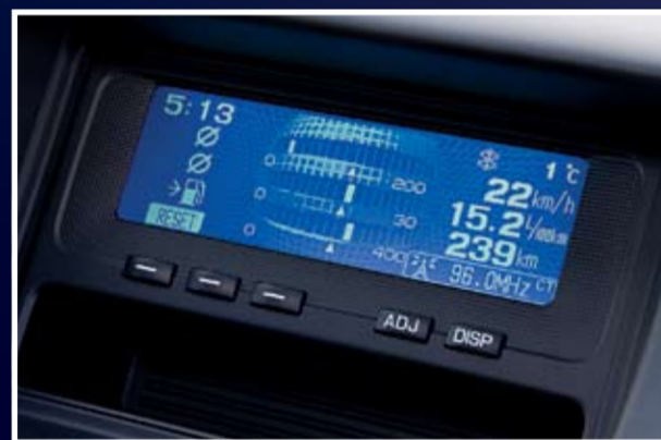
На дисплей можно вывести показания борткомпьютера, компаса или меню настроек аудиосистемы.