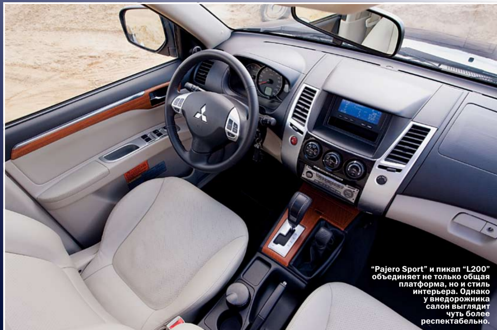
"Pajero Sport" и пикап "L200" объединяет не только общая платформа, но и стиль интерьера. Однако у внедорожника салон выглядит чуть более респектабельно.