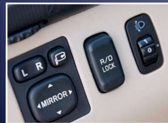
Трансмиссия "Super Select" и принудительная блокировка заднего дифференциала – штатное оборудование.