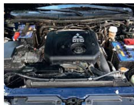
Для объема 3,2 л мощность двигателя невелика — 170 л.с. Зато крутящий момент — 373 Нм

для наследника чемпиона «Дакара»? Кстати, прежде чем покинуть твердую поверхность и окунуться в глинистое месиво, необходимо привести в полную боевую готовность внедорожный арсенал автомобиля. А в этом плане новинке есть чем похвастаться — в отличие от предшественника, где полный привод назывался Easy Select 4WD и отличался от обычного Part-time только тем, что допускал подключение переднего моста на скоростях до 100 км/ч, Sport второго поколения получил продвинутый Super Select 4WD. Кроме трех основных режимов работы (только задний привод, жестко подключенный передний мост и понижающий ряд трансмиссии), у нашего героя есть возможность задействовать полный привод и на асфальте, когда крутящий момент между осями распределяется через межосевой дифференциал. Неплохое подспорье, особенно зимой, когда наледи и сугробы на дорогах чередуются с сухим покрытием.