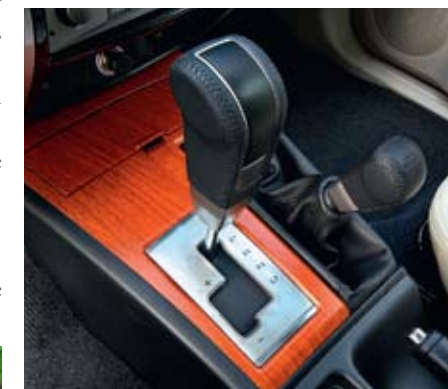
За изменение режимов работы трансмиссии отвечает обычный рычаг