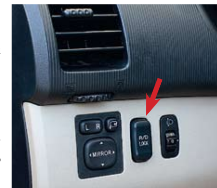
Чтобы заблокировать задний дифференциал, достаточно нажать клавишу на торпедо