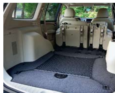
Объем багажника можно увеличить более чем вдвое, сложив второй ряд кресел