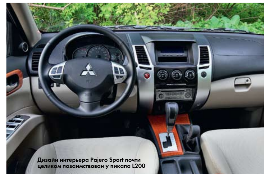
Дизайн интерьера Pajero Sport почти целиком позаимствован у пикапа L200