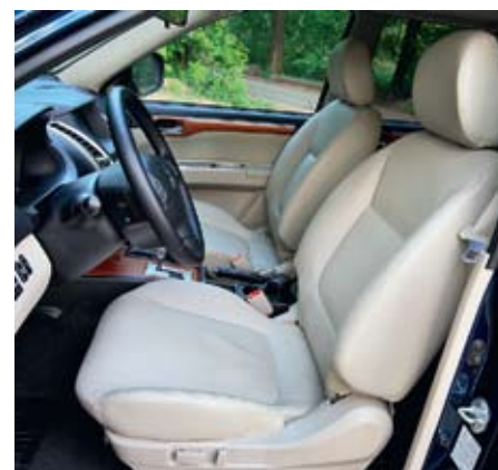
На водительском месте с должным комфортом устроится человек любого роста