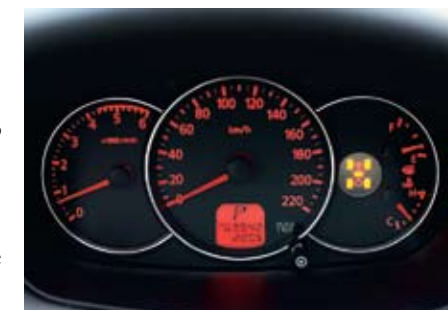
Доходчивая пиктограмма на панели приборов отражает режим работы трансмиссии

В нашей стране, как это ни странно, асфальт рано или поздно заканчивается, да и мне, в силу своей профессии, не терпелось проверить Pajero Sport на заветных косяках. Да еще и погода старалась вовсю: непрекращающийся уже вторые сутки ливень сделал свое дело, превратив относительно проезжую грунтовку в мыльно-глинистый раствор с глубокими колеями. Но для нас чем труднее, тем лучше — не это ли самое достойное испытание