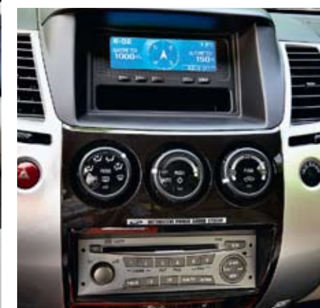
В суфлерской будке над центральным торпедо есть и компас и альтиметр