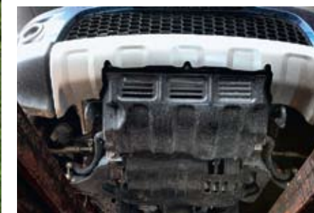
Штатная защита силового агрегата и выглядит внушительно, и от грязи спасает