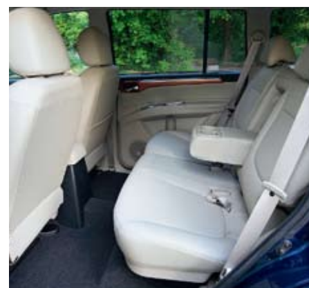
Второй ряд сидений может перемещаться вперед-назад в широком диапазоне

ры, а мост пассажирской модели — пружины. Особую популярность машины приобрели в Штатах за океаном, где подобный подход к созданию внедорожников скорее правило, нежели исключение.