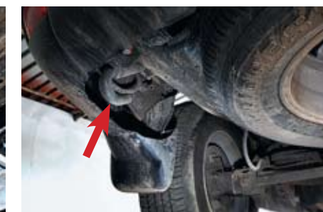
Буксировочная проушина хорошо замаскирована: если не знать — сразу не найдешь