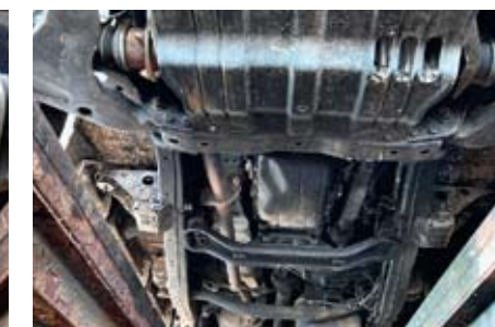
Все основные узлы и агрегаты, включая выпускную систему, спрятаны в недра рамы